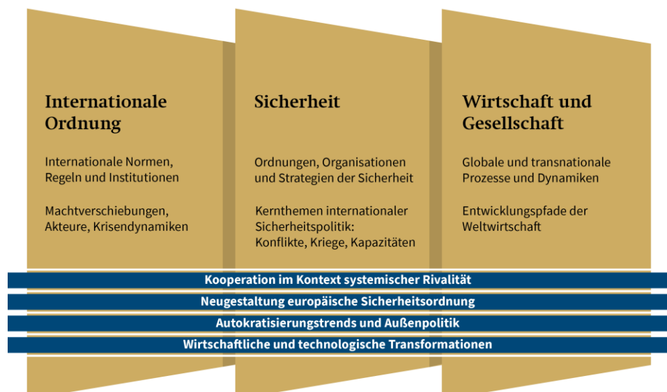
Abbildung: Perspektiven und übergreifende Themenlinien der Forschung

Aus dieser breit angelegten Forschung entstehen aktualitätsbezogene und grundlegende Analysen sowie Beratungsangebote zu spezifischen Fragestellungen, aber zugleich lassen sich daraus Beiträge zu den vier übergreifenden Themenlinien schöpfen.